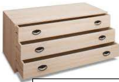
夏の水蒸気をシャットアウト！食品や衣類を長持ちさせる 桐のタンスと茶筒